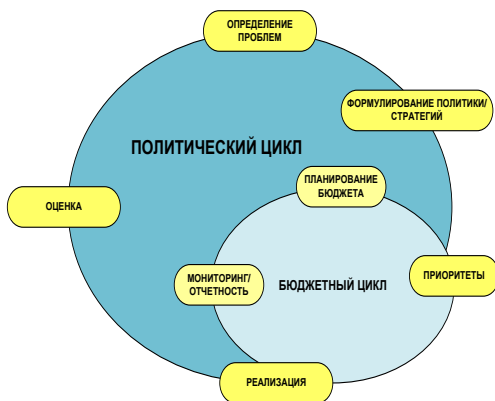
Область В – Обеспечение руководства